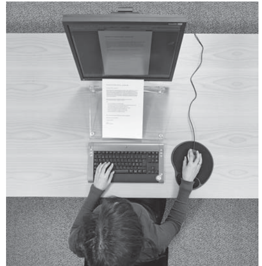
Bild 1: Der Bildschirmarbeitsplatz muss eine genügende Tiefe aufweisen, damit Tastatur, Bildschirm und Dokumente hintereinander Platz finden.