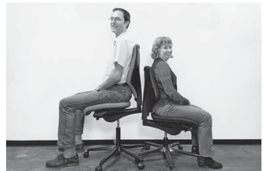
Bild 3: Für grosse Personen sind Standardstühle meistens ungeeignet. Viele Hersteller bieten ihre Stühle auch in einer Grossvariante an.