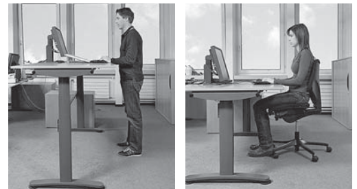
Bild 2: Ein Verstellbereich von 65 bis 125 cm gewährleistet, dass am Tisch sowohl kleine Personen sitzend als auch grosse Personen stehend arbeiten können.