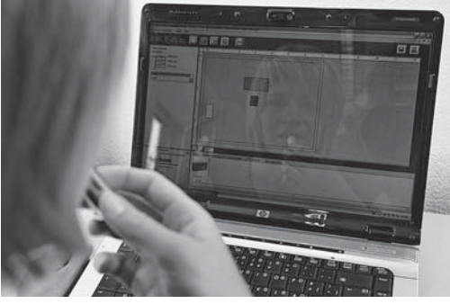
Bild 7: Bildschirme mit spiegelnder Oberfläche sind aufgrund störender Reflexionen nicht geeignet für die Bildschirmarbeit.