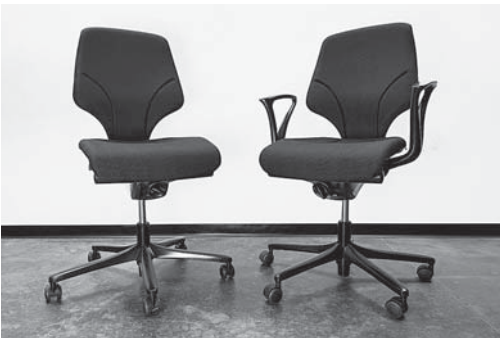
Bild 5: Armlehnen erleichtern Mitarbeitenden mit grossem Körpergewicht oder Knieproblemen das Aufstehen. Aus ergonomischer Sicht sind sie nicht notwendig.