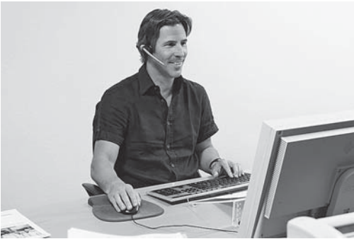
Bild 8: Wenn am Bildschirmarbeitsplatz häufig telefoniert werden muss, ist ein Headset unabdingbar.

Weitere Informationen • Bildschirmarbeit. Wichtige Informationen für Ihr Wohlbefinden, Informationsschrift, 24 S. A4, Bestell-Nr. 44034.d • Arbeiten am Bildschirm. Entspannt statt verspannt – die Tipps, Faltprospekt, Bestell-Nr. 84021.d • www.suva.ch/ergonomie