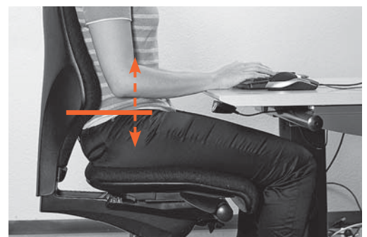
Bild 4: Die Höhenverstellung der Rückenlehne ermöglicht die genaue Positionierung des Lendenbäusches.